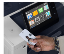
Kártyaolvasó-foglalat beépített USB-aljzattal. 3

kinált 520 lapos 2 1. tálcába 139,7 x 182 mm – 297 x 431,8 mm (5,5 x 7,17" – 11,69 x 17") méretű hordozóanyagok helyezhetők.