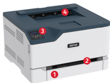
Xerox ® C230 színes nyomtató